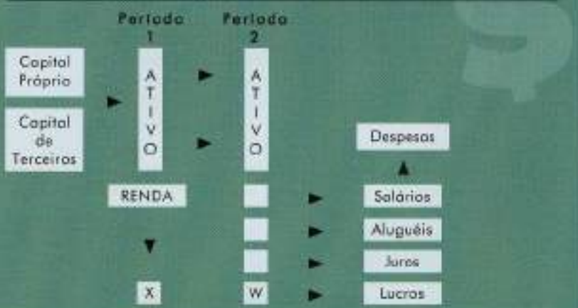
FIGURA 3 Teoria da Empresa / Corporação

Fonte: LEÃO, Luciano de Castro Garcia e FERNANDES, Washington Maia. A Procura de um elo entre os conceitos contábeis e econômicos de renda nos negócios. Revista Brasileira de Contabilidade. Brasília: CPC, n. 115, janeiro/fevereiro de 1999.