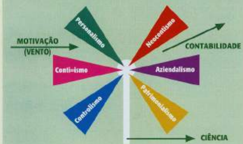
FIGURA 2 – Representação metafórica – Teoria da Contabilidade